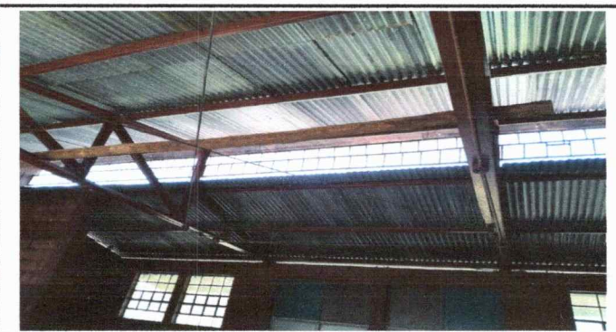
Foto 6: Parte de la estructura del techo muestra como es reforzado con madera

Observación: Si es necesario se pueden agregar hojas adicionales y actualizar el número de hojas.