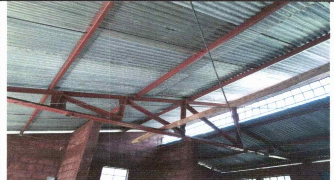
Foto 2: La estructura metalica del establecimiento no son aptas para su uso