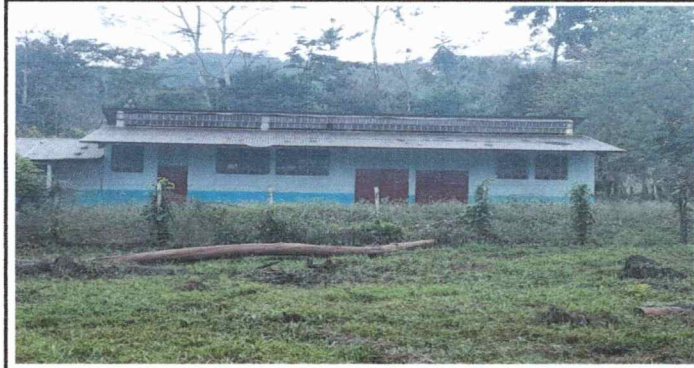
Foto 1: El techo del modulo 1 del establecimiento requiere sustitucion